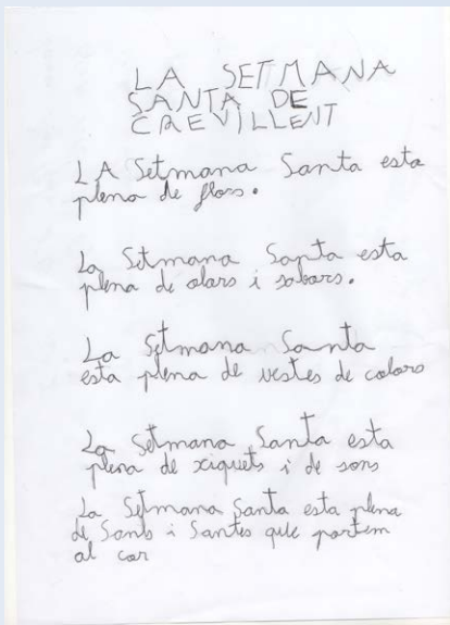
1er. Premio Ciclo I

La participación en este Certamen supone la aceptación de todas y cada uno de los apartados de las Bases. En Crevillent, febrero de 2021